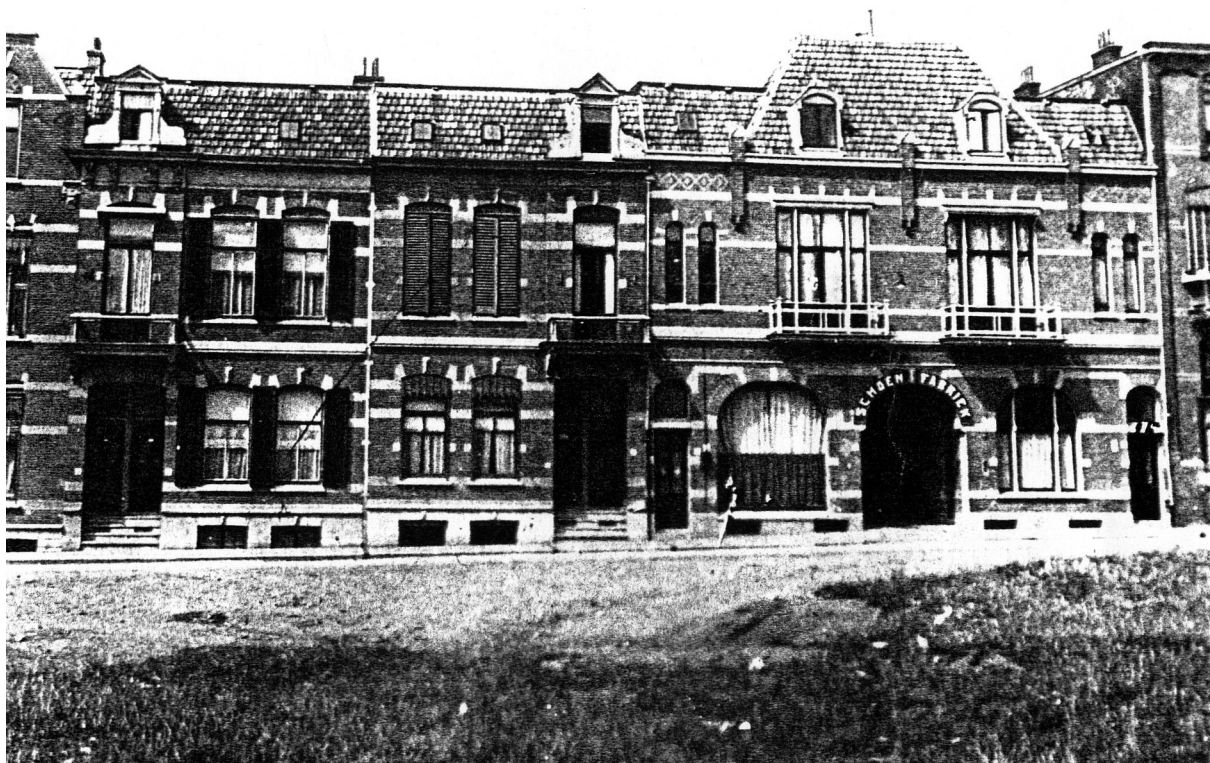
Nr. 21 23 25 27 29 Dit is de Hugo de Grootstraat te Nijmegen rond 1930. Thermion zat van 1931-1937 op de nummers 21 tm 29.